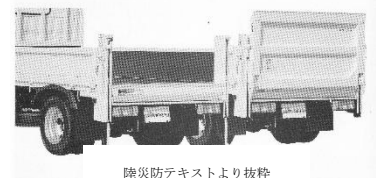
陸災防テキストより抜粋