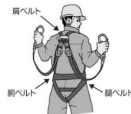
フルハーネス型安全帯